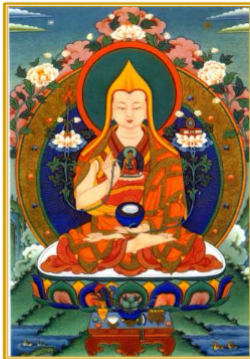
TSONGKHAPA LOSANG DRAGPA